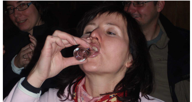
Einlösung einer Ehrenschild aus dem Jahr 2009